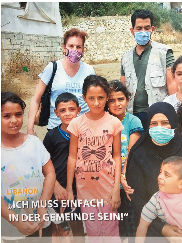
LIBANON „ICH MUSS EINFACH IN DER GEMEINDE SEIN!“