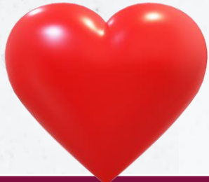
Millenials (Gen Y)